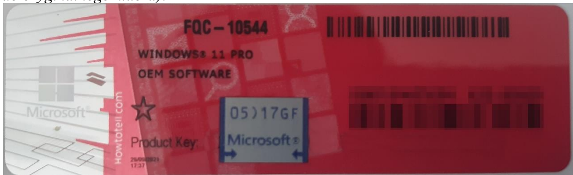
Rys. 1 przykładowy kod zabezpieczony przez producenta systemu Microsoft Windows 11 (takie same naklejki mają Windows 10) z wymazanym, znajdującym się przed i za szarą naklejką kodem licencyjnym

Poniższe zdjęcie obrazuje obecnie stosowane zabezpieczenia producenta firmy Microsoft (klucz systemu jest zabezpieczony naklejką hologramową przez producenta. Po jej zdrapaniu uzyskujemy dostęp do oryginalnego klucza):