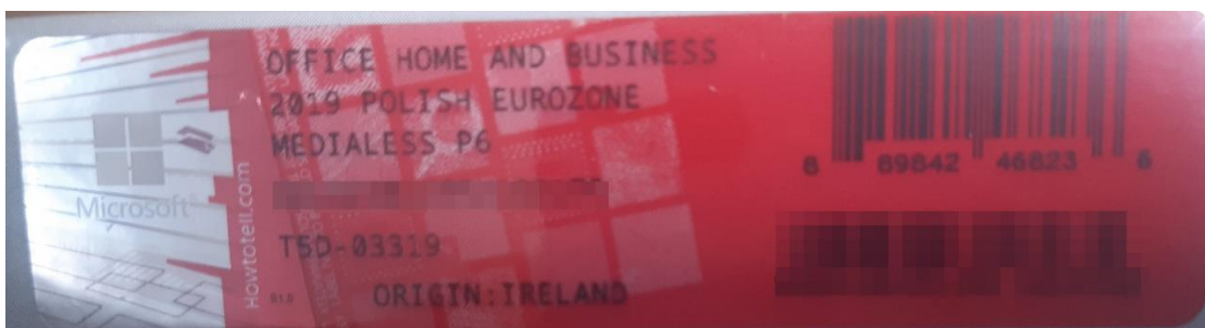
Rys. 2 przykładowy kod zabezpieczony przez producenta systemu Microsoft Windows Office Home&Business z wymazanym, znajdującym się w prawym dolnym rogu numerem seryjnym produktu. Kod licencyjny znajduje się w środku szczelnie zapakowanego i zafoliowanego pudełka (Rys. 3)